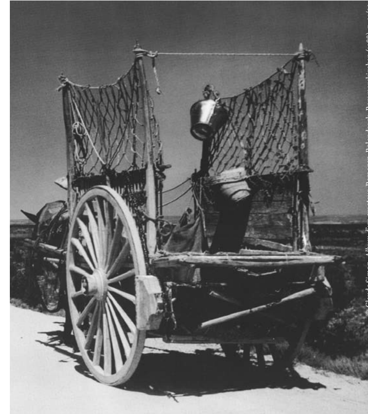
© Claude Simon, Album d'un amateur , Remagen-Rolandseck, Rommerskirchen (1988), p. 21/22